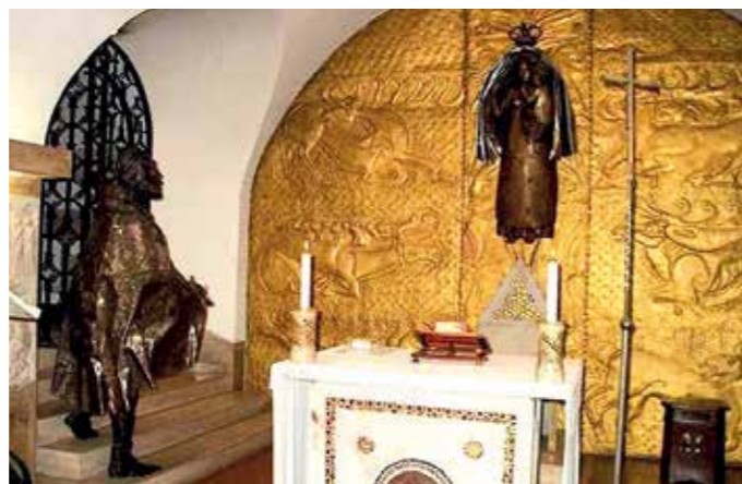
Varga Imre szoborkompozíciója a római Szent Péter-bazilika magyar kápolnájában.

E felemelő jelenet ihlette Varga Imre szobrászművészt a római Szent Péter-bazilika magyar kápolnájában látható szoborkompozíció megalkotására: Szent István a Szűzanyának nyújtja Magyarország koronáját.