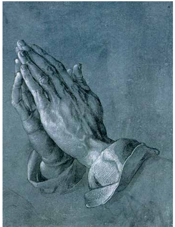
Albrecht Dürer: Imádkozó kéz (tanulmány)